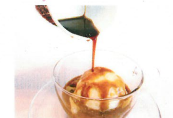
カフェアフォガード ¥550