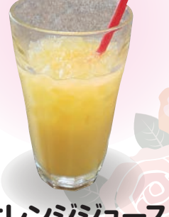
オレンジジュース 오렌지 주스 orange juice