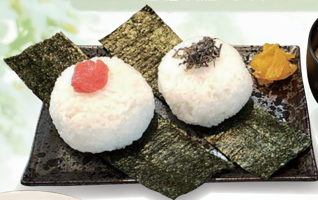
おにぎりセット 주먹밥 세트 rice ball set