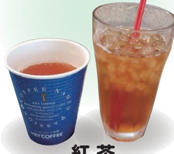
紅茶 홍차 black tea