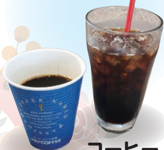
コーヒー 커피 coffee