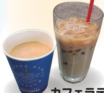
カフェラテ 카페라테 cafe latte