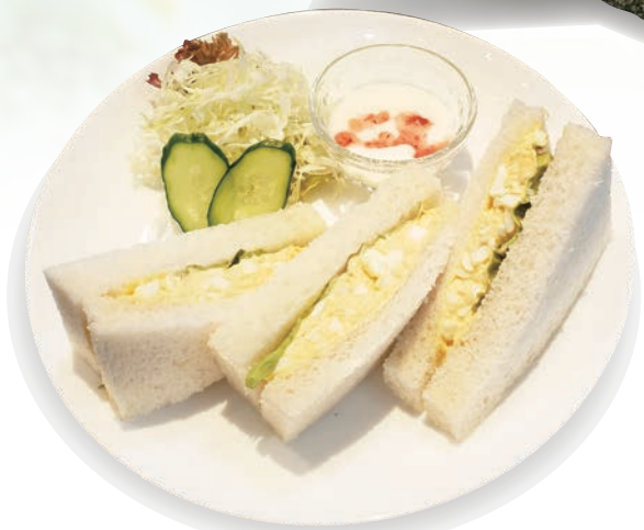
タマゴサンドセット 달걀 샌드 세트 egg sandwich set