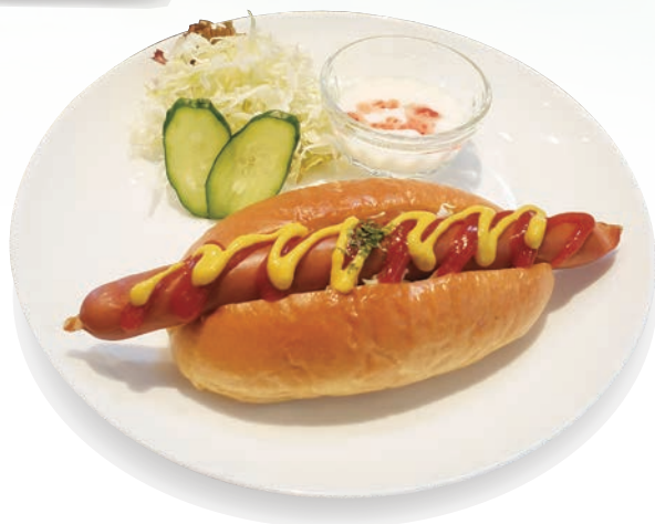
ホットドッグセット 핫도그 세트 hot dog set